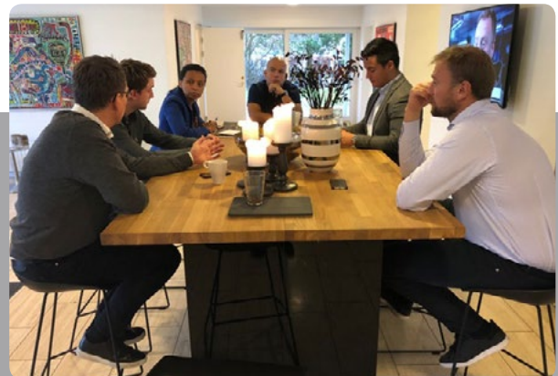
Teams fra vores internationale kontorer mødes i HQ.