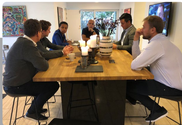
Teams fra vores internationale kontorer mødes i HQ.