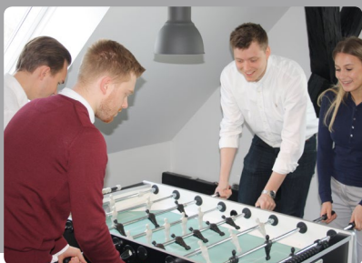
Sammenhold, sjov og fredagsbar i vores slyngelstue er også en del af "BPI ELEV TEAM"

HOS OS BEDØMMER VI DIG IKKE KUN UD FRA DIT SKOLEBEVIS, MEN TAGER ALLE ASPEKTER AF DIN PERSONLIGHED MED I BETRAGTNING.